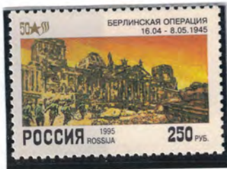
50-летию окончания ВОВ посвящен почтовый блок Республики Уганда «Взятие Берлина» с изображением в зеркальном варианте